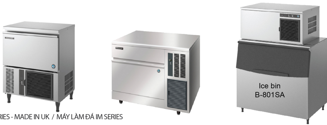
ICE MAKER - IM SERIES - MADE IN UK / MÁY LÀM ĐÁ IM SERIES