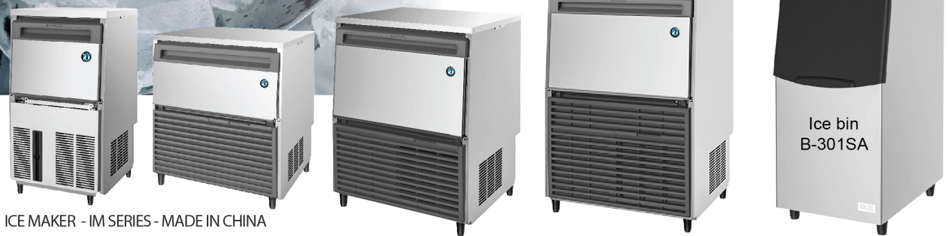
ICE MAKER - IM SERIES - MADE IN CHINA